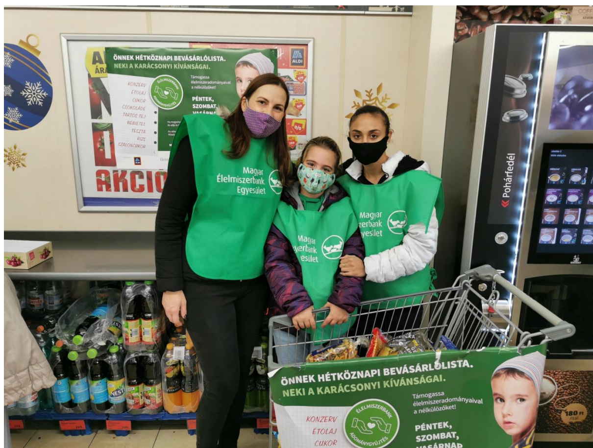
A gyűjtés egyik csapata az ALDI-ban

A gyűjtésben nevelőinken és növendékeinken kívül még önkéntesek is részt vettek, segítve ezzel ezt a rendkívül kemény gyűjtőmunkát.