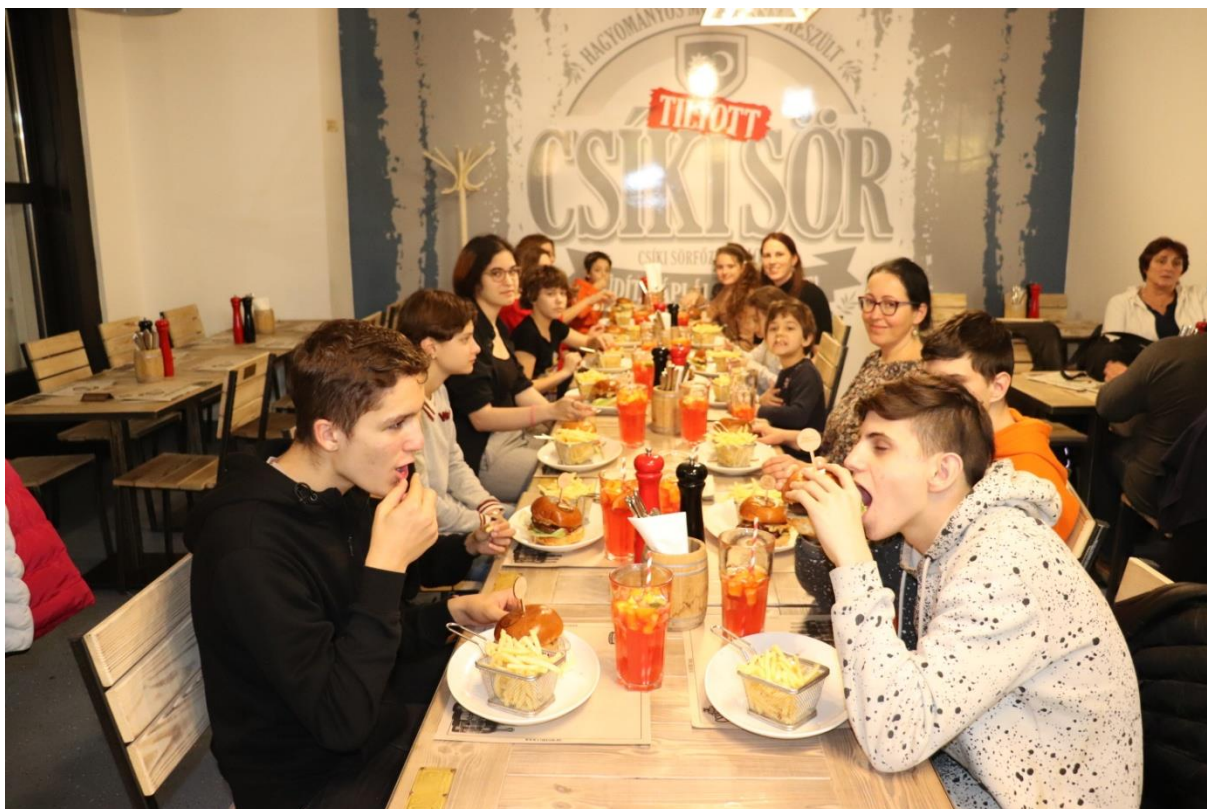
A résztvevők jutalomvacsorája