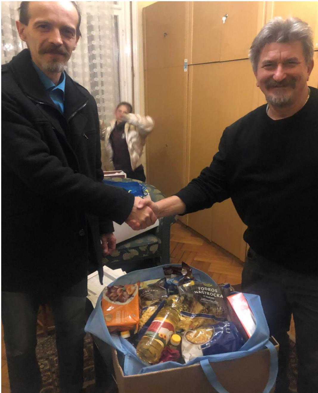
Osztás a családoknak a koleszban

Köszönet illet minden gyermek és felnőtt résztvevőt, akik hozzájárultak ehhez a ragyogó teljesítményhez, öregbítve ezzel kollégiumunk hírnevét is.